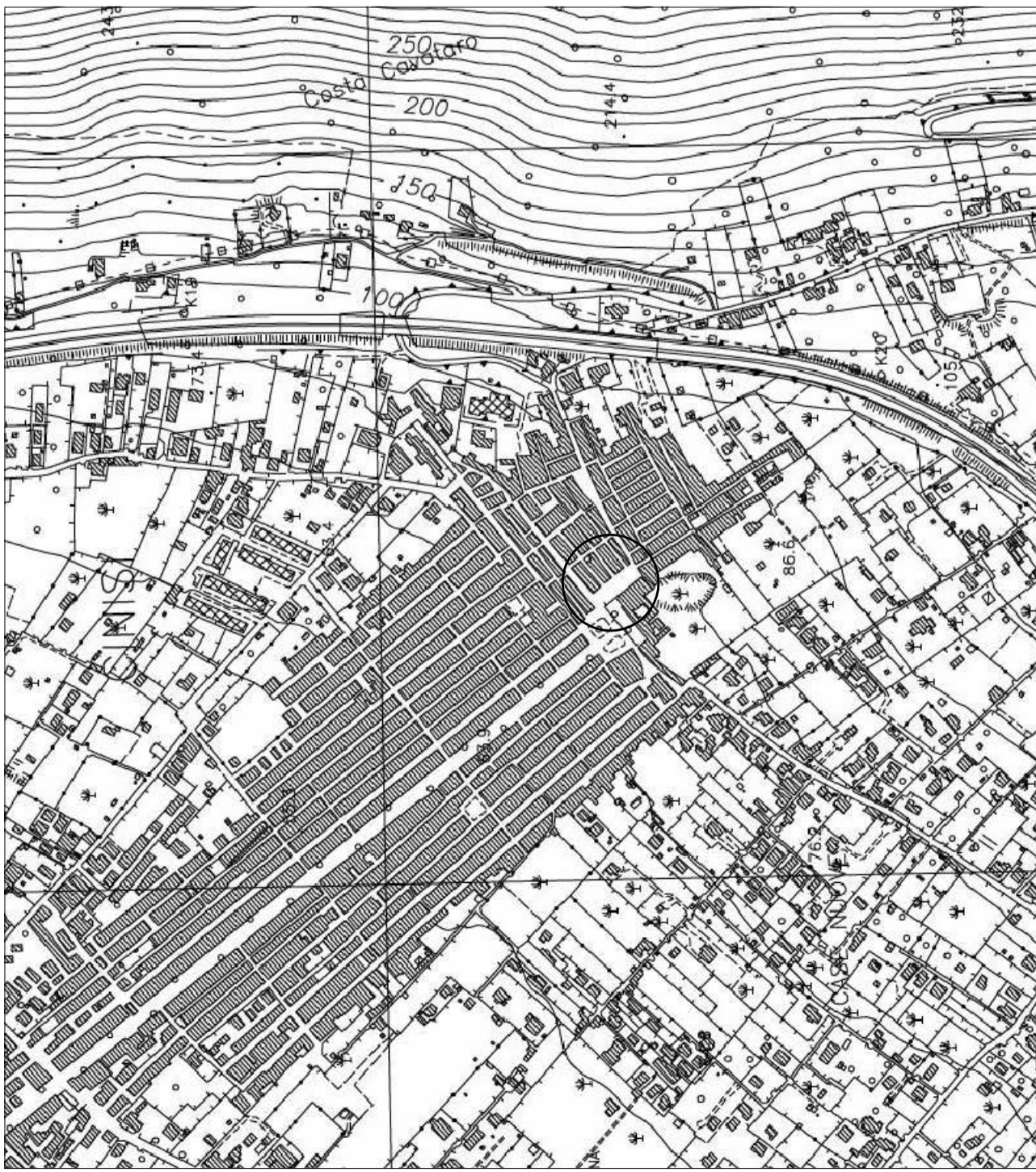
carta tecnica regionale scala 1:10.000